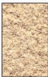
S 2020-Y20R Sable orangé