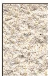
S 0603-Y20R Pierre claire