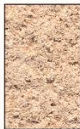
S 1515-Y50R Rose foncé

Enduits prêt à l'emploi Finition gratté fin